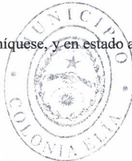
RAMON E. BARRERA INTENDENTE MUNICIPIO DE COLONIA ELIA